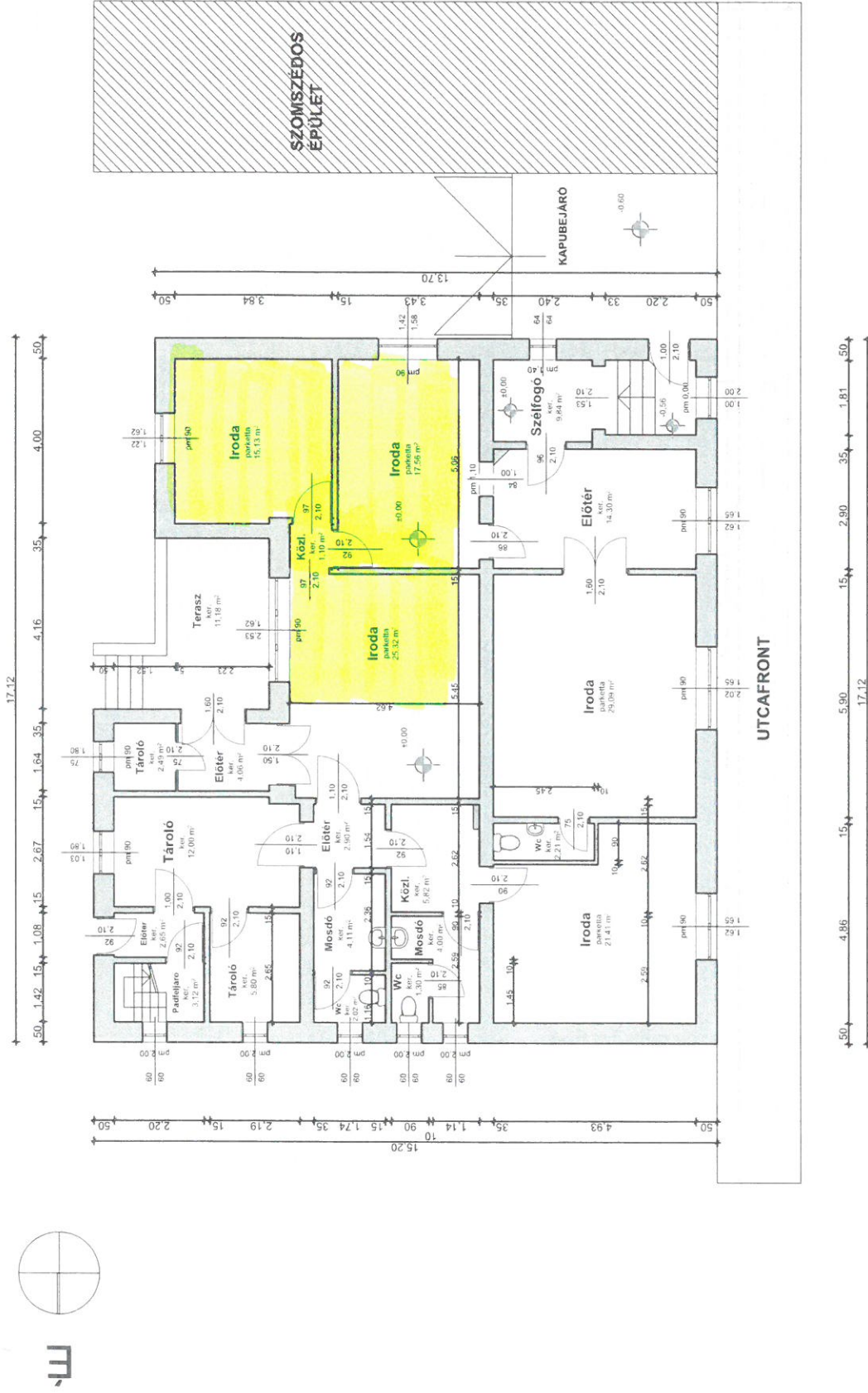
Mátészalka Város Önkormányzata (4700 Mátészalka, Hősök tere 9.sz.) 4700 Mátészalka, Kazinczy u. 4.sz. alatti 2592 hrsz-ú ingatlanon lévő Irodaépület felmérési alaprajz